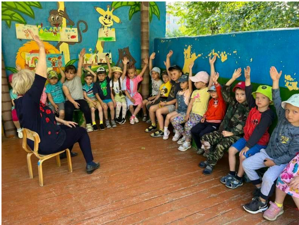
Сказка «Заюшккина избушка»