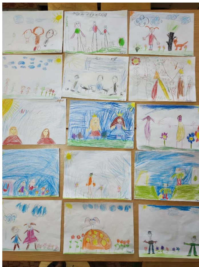
Рисование на тему «Дружба»