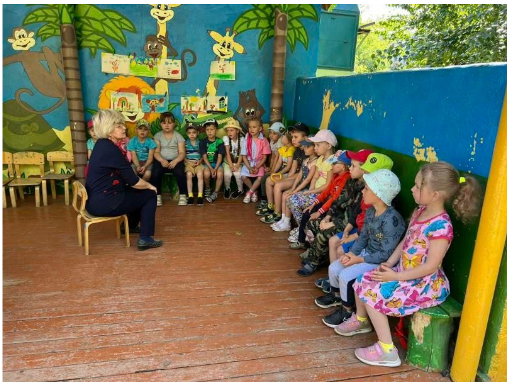
Обсуждение пословиц и поговорок про дружбу