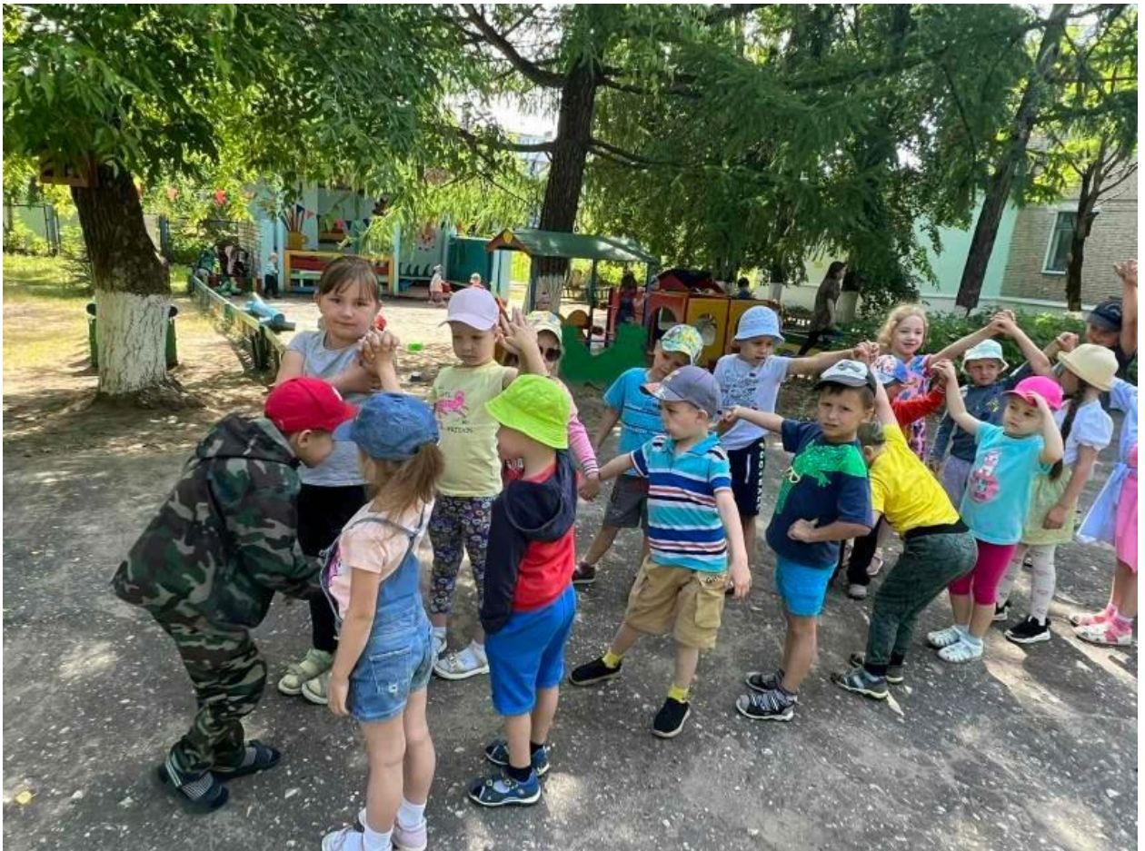
Игра «Дружный ручеек»