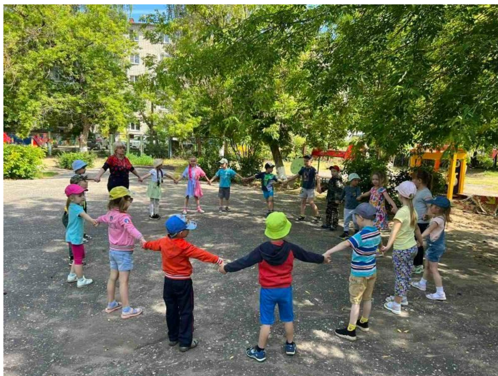
Игра «Слушайте внимательно!»