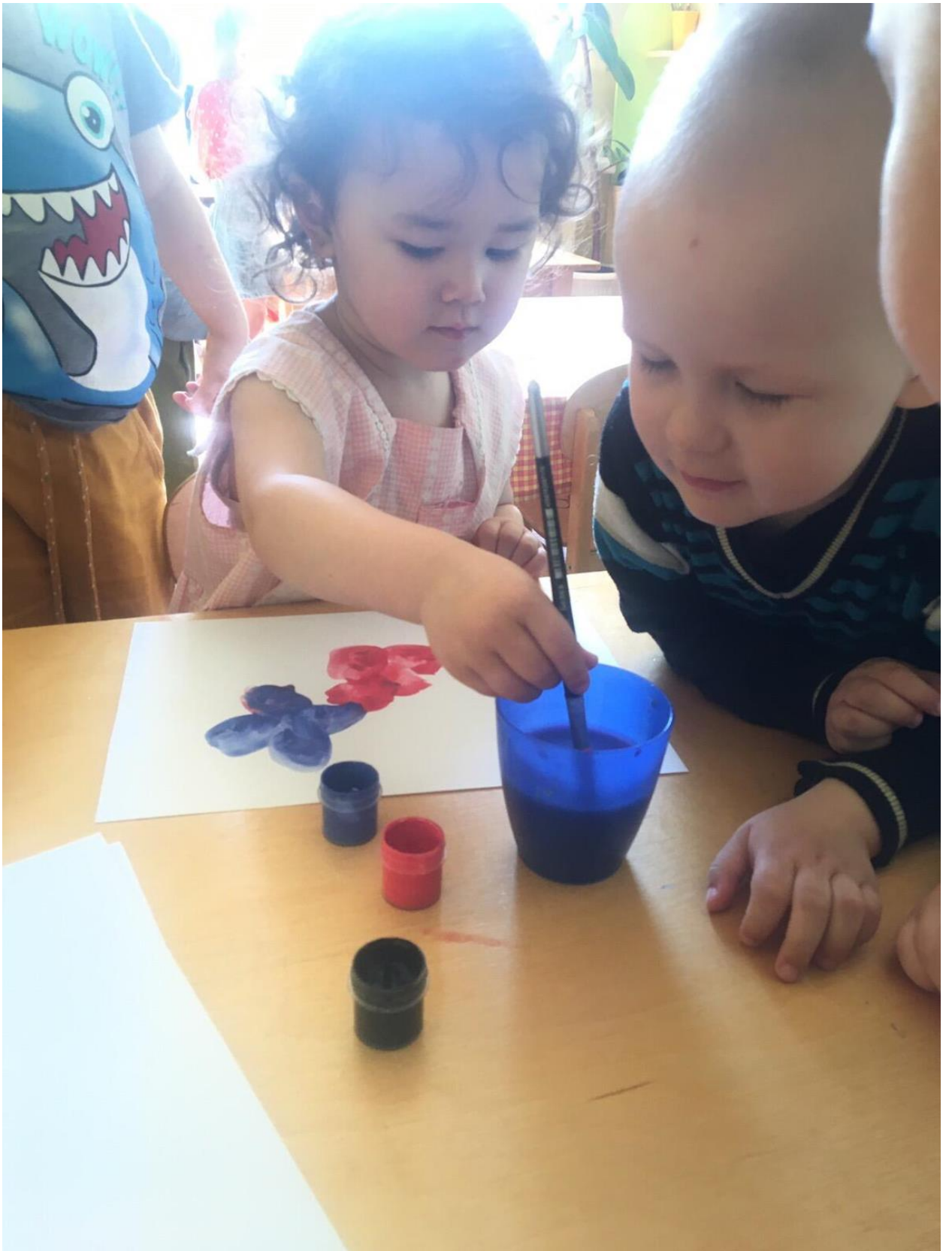
рисование «летние цветы»