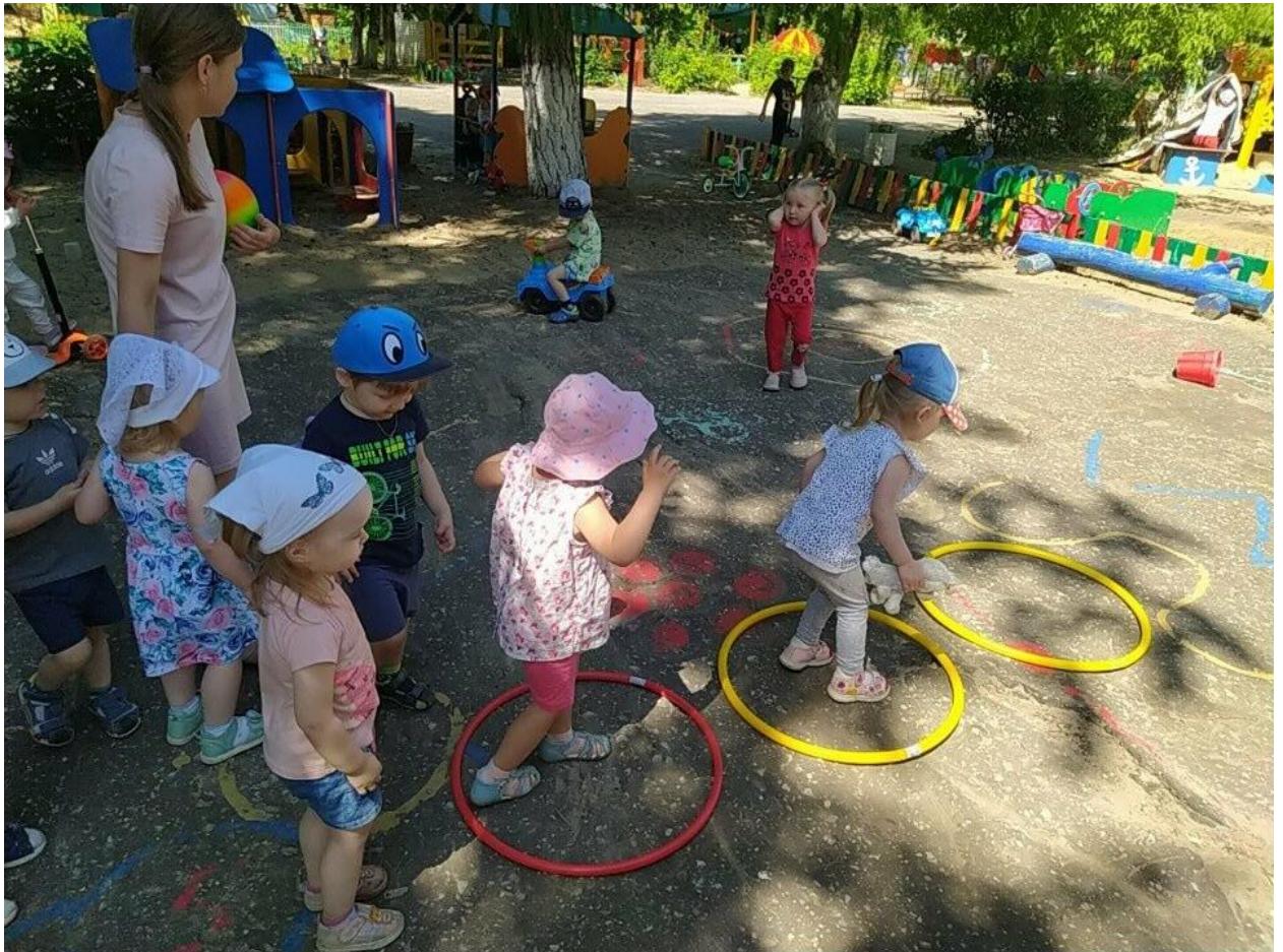
физкультура на воздухе