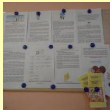
Группа раннего возраста - информационный стенд для родителей "вакцинация За и Против?"