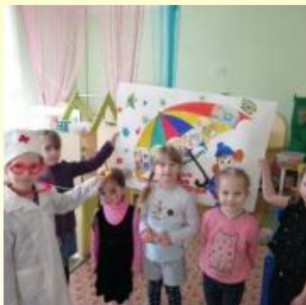
Старшая группа - Стенгазета "Прививки полезны и важны"