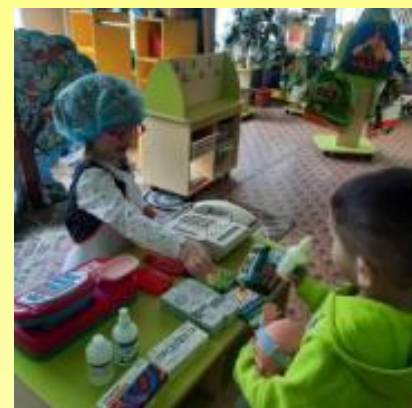
Младшая группа - сюжетно-ролевые игры "Больница", "Аптека"