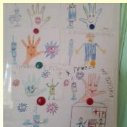
Подготовительная группа - выставка рисунков "Я прививок не боюсь!"