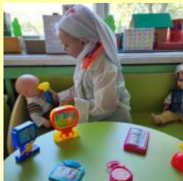
Средняя группа - игровые ситуации "я бы доктором пошел, пусть меня научат!"