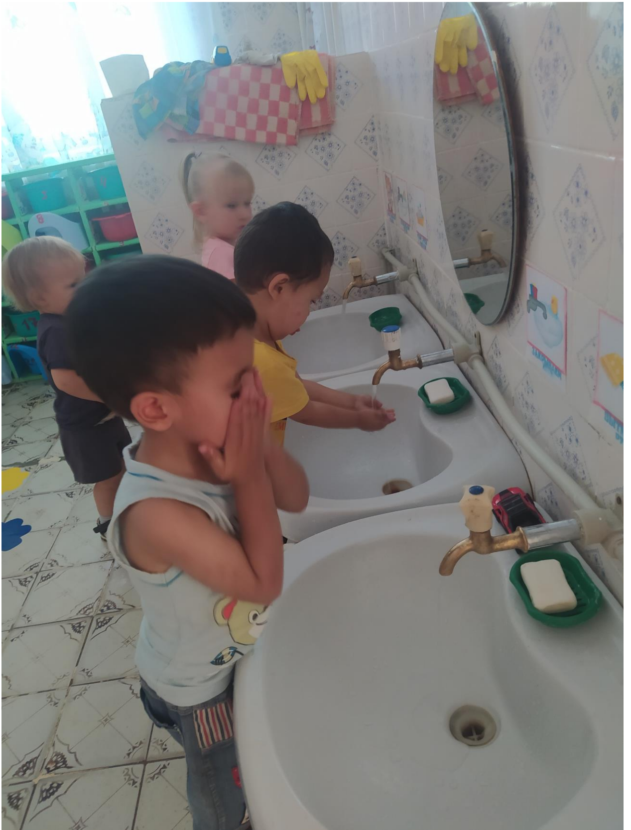
Моем руки перед едой